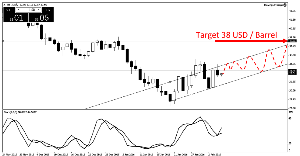
Trend Harga Minyak Dunia harian cenderung menguat

Kinerja harga minyak mingguan memberikan sinyal bahwa harga minyak cenderung menguat dalam untuk menguji level 38 USD / Barrel